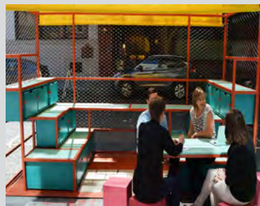
Temporäres Sitzungszimmer in San Francisco