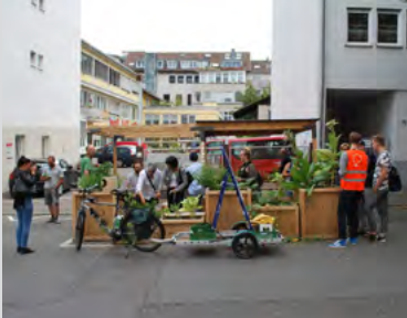
Urbanes Gärtnern auf dem Parklet im Stuttgarter Westen

Grundsätzlich sind Deiner Kreativität keine Grenzen gesetzt. Das Ziel sollte jedoch stets sein mit dem Parklet einen Mehrwert für Stadt und Nachbarschaft zu schaffen. Ein Parklet ist Bestandteil des öffentlichen Raums, das bedeutet dass es jederzeit für jeden zugänglich sein muss. Alles was Du auch sonst gerne draußen in der Stadt unternimmst, oder was Dir darin fehlt, kannst Du in dessen Gestaltung umsetzen. Du kannst zum Beispiel den Straßenraum begrünen und gärtnern, einen Treffpunkt für den nachbarschaftlichen Austausch schaffen oder einen Ort für Spiel und Spaß gestalten. Sieh Dir doch einfach einige Beispiele aus Stuttgart und anderen Städten auf der ganzen Welt an.