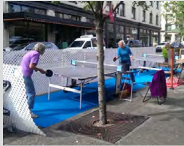
Tischtennis auf der Straße in Portland, Oregon