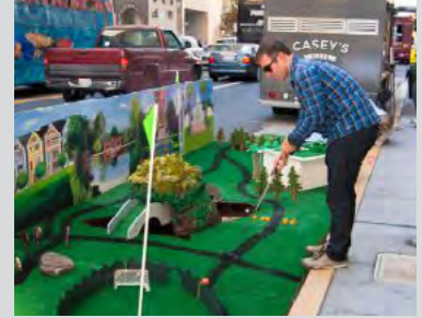
Minigolfplatz in Kalifornien zum Parking Day 2012