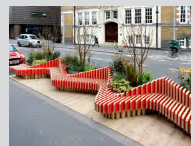
Eine laaange Parkbank in London