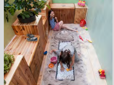
Ein Kinderspielplatz wie letztes Jahr in Stuttgart