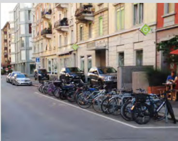
Fahrradstellplätze in Zürich