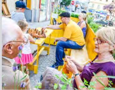
Ein Wohnzimmer im Freien für Jung und Alt in Wien