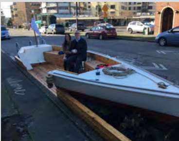
Auch ein Boot bietet mehr als ein Auto, wie hier in Seattle